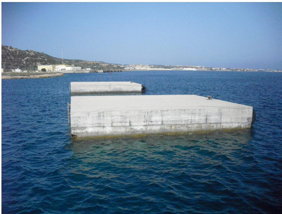
Figura 15 Vista 03 (Ante Operam)

Procedura di Verifica di Assoggettabilità alla VIA a sensi dell'art.20, Titolo III, Parte II del D.Lgs. 152/2006 e s.m.i. per l'intervento di "Riconfigurazione del pontile sud dell'isola di Santo Stefano nel Comune de La Maddalena - Batteria Punta dello Zucchero, Regione Sardegna"