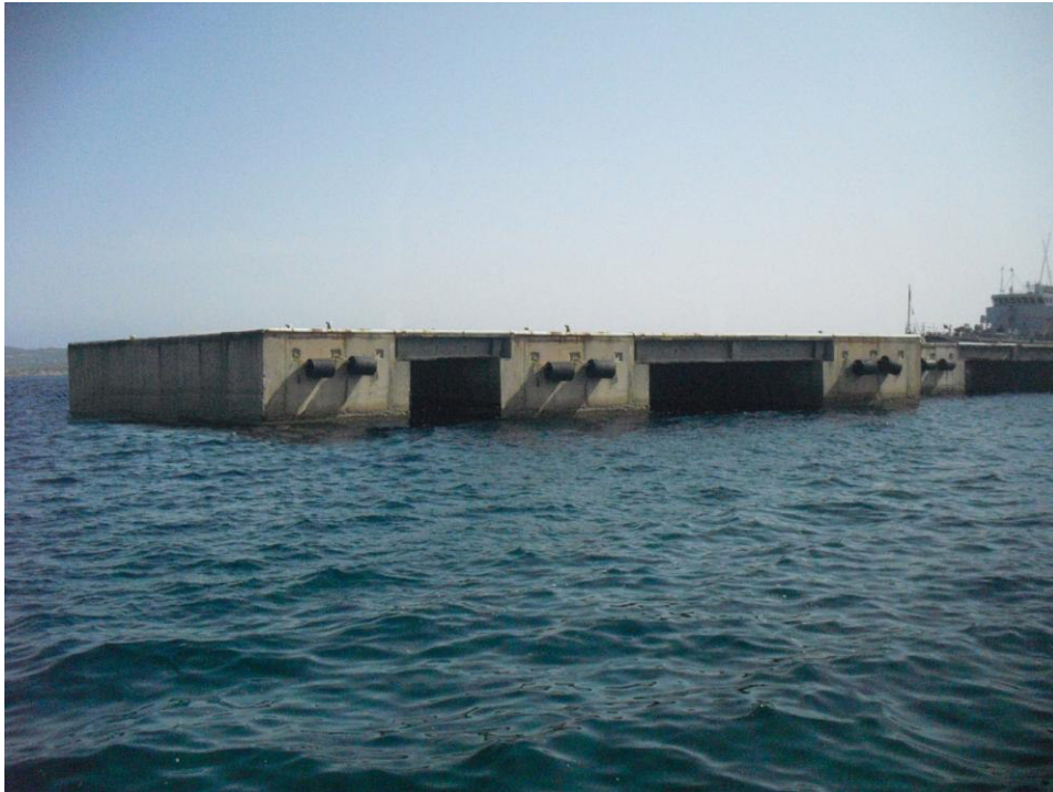
Figura 14 Vista 02 (Post Operam)