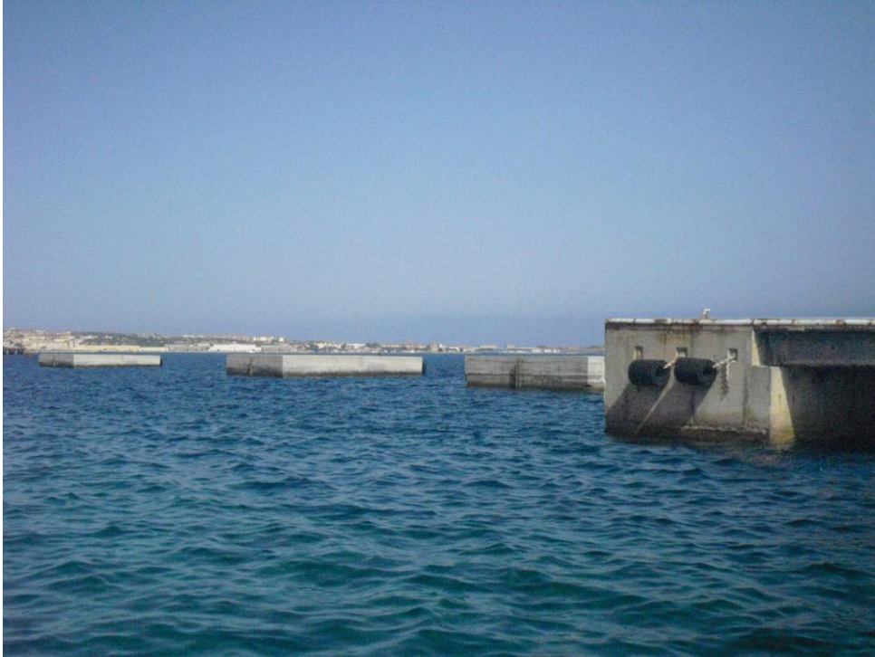
Figura 18 Vista 04 (Post Operam)

Procedura di Verifica di Assoggettabilità alla VIA a sensi dell'art.20, Titolo III, Parte II del D.Lgs. 152/2006 e s.m.i. per l'intervento di "Riconfigurazione del pontile sud dell'isola di Santo Stefano nel Comune de La Maddalena - Batteria Punta dello Zucchero, Regione Sardegna"