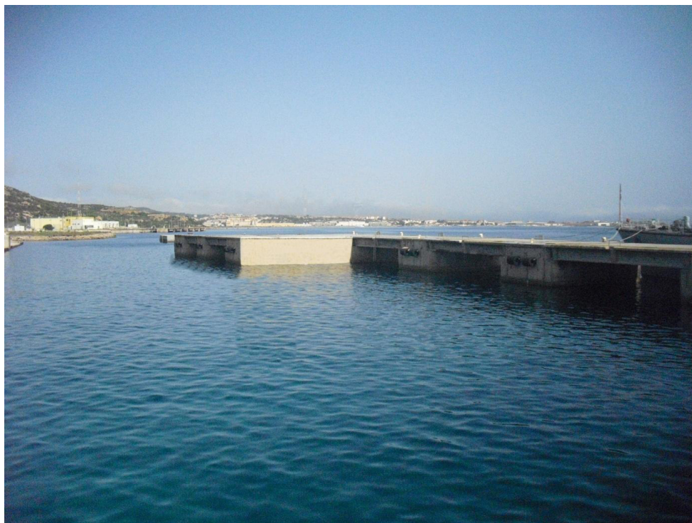
Figura 12 Vista 01 (Post Operam)

Procedura di Verifica di Assoggettabilità alla VIA a sensi dell'art.20, Titolo III, Parte II del D.Lgs. 152/2006 e s.m.i. per l'intervento di "Riconfigurazione del pontile sud dell'isola di Santo Stefano nel Comune de La Maddalena - Batteria Punta dello Zucchero, Regione Sardegna"