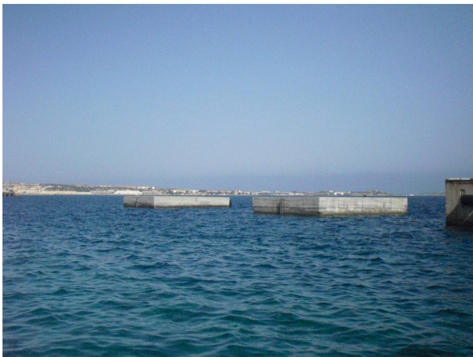
Figura 17 Vista 04 (Ante Operam)