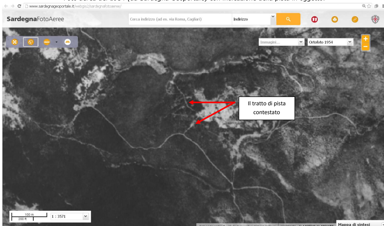
Foto aerea del 1954 con indicazione della pista in oggetto.

Spiace constatare che, anche al di là dell'evidenza dei fatti , di documentazione e immagini, l'utilizzo di termini tecnici in maniera non precisa finisce con il veicolare un messaggio distorto . Il lettore, infatti, potrebbe essere tratto in inganno proprio dalla parola "strada" utilizzata al posto di "pista". Tra i due termini è netta invece la differenza: